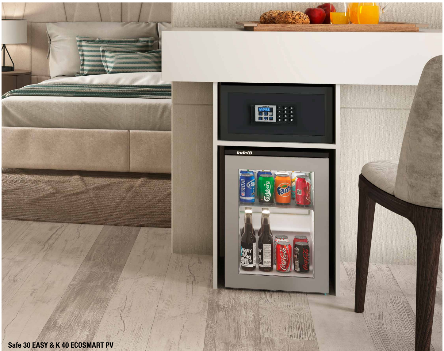
Safe 30 EASY & K 40 ECOSMART PV

Verkaufsunterlagen / Prospectus: Indel B Hospitality solutions