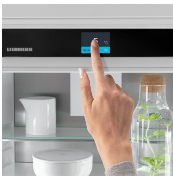
Écran Touch & Swipe

Vous souhaitez que votre filet de veau tendre ou que votre lait frais le reste le plus longtemps possible ? Les compartiments BioFresh en sont la garantie : la température dans le compartiment DrySafe avoisine les 0 °C, ce qui représente des conditions de stockage idéales pour les aliments les plus sensibles. Et le meilleur reste à venir : tout est parfaitement réglé d'usine pour une utilisation immédiate, et une fraîcheur encore plus longue.