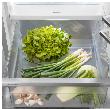
Compartment Fruit & Vegetable

Pour une salade ou des fraises toujours croquantes : les aliments les plus délicats méritent un endroit spécifique pour rester frais plus longtemps. C'est possible avec les compartiments BioFresh. Dans le compartiment Fruit & Vegetable, la température est proche de 0 °C. Grâce à la fermeture hermétique, les fruits et légumes non emballés qui y sont conservés restent particulièrement agréables à consommer en raison de l'humidité permanente qui y règne. Vous n'avez aucun réglage à faire.